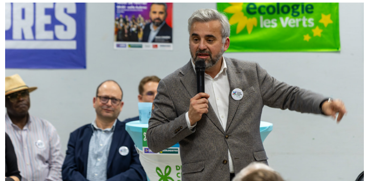
"L'union, c'est une culture ! L'union, il faut la vouloir." - Alexis Corbière